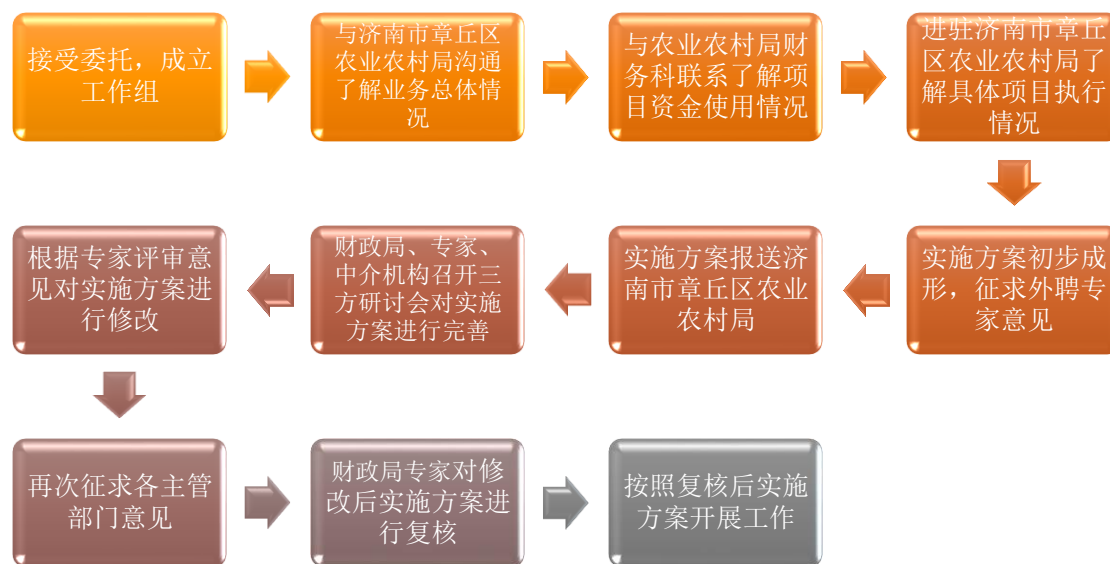
图 1：前期准备工作流程图