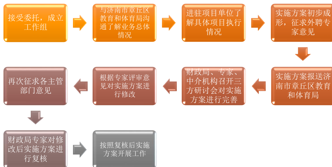
图 1：前期准备工作流程图